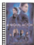
ANIQUILACIÓN Alex Garland (2018) Ciencia-Ficción

Cinco mujeres científicas investigan la zona X, un intrigante lugar controlado por una poderosa fuerza alienígena del que no han regresado anteriores expediciones. Es una película inquietante y sorprendente que consigue crear una atmósfera hostil gracias a la fotografía y a la música. Sería una película profundamente original si no hubiera existido Andrei Tarkovski.