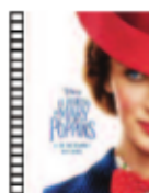
EL REGRESO DE MARY POPPINS Rob Marshall (2018) Cine infantil

Un drama de época peculiar, personal y, por supuesto, conociendo a Lanthimos, turbio. Narra el ascenso desde lo más bajo de una mujer en la corte inglesa del siglo XVIII. Lo hace de la mano de la que es a la vez su protectora y su rival. Lo que sigue es un juego tan divertido como cruel, a la vez fluido y terriblemente retorcido.