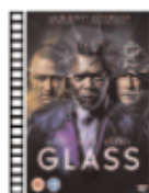
GLASS (Cristal) M. Night Shyamalan (2019) Suspense

Cinco mujeres científicas investigan la zona X, un intrigante lugar controlado por una poderosa fuerza alienígena del que no han regresado anteriores expediciones. Es una película inquietante y sorprendente que consigue crear una atmósfera hostil gracias a la fotografía y a la música. Sería una película profundamente original si no hubiera existido Andrei Tarkovski.