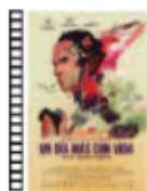
UN DÍA MÁS CON VIDA Raúl de la Fuente y Damian Nenow (2018) Animación

Mary Poppins es la niñera casi perfecta, con unas extraordinarias habilidades mágicas para convertir una tarea rutinaria en una aventura inolvidable y fantástica. En esta nueva secuela vuelve para ayudar a la siguiente generación de la familia Banks a encontrar la alegría y la magia que faltan en sus vidas.