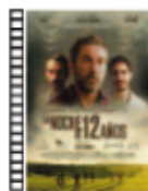
LA NOCHE DE 12 AÑOS Álvaro Brechner (2018) Drama

Todo lo que sabemos de la guerra del narcotráfico en Colombia tiene voz masculina. Nadie había preguntado nada sobre las mujeres hasta que Cristina Gallego y Ciro Guerra llegaron hace diez años a La Guajira. Los habitantes de la zona les contaron sobre la bonanza marimbera en los años 70. La película está narrada por capítulos, haciéndola literaria, casi poética.