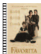
LA FAVORITA Yorgos Lanthimos (2018) Comedia

Explora la historia real sobre cómo Dick Cheney, un callado burócrata de Washington, acabó convirtiéndose en el hombre más poderoso del mundo como vicepresidente de los Estados Unidos durante el mandato de George W. Bush, con consecuencias en su país y el resto del mundo que aún se dejan sentir hoy en día.