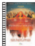
PÁJAROS DE VERANO Cristina Gallego y Ciro Guerra (2018) Drama

Estados Unidos, década de 1970. Seguimos a Jack durante un período de 12 años, descubriendo los asesinatos que marcarán su evolución como asesino en serie. El siempre provocador Lars von Trier ofrece aquí una mezcla de juego perverso, comedia negra, 'thriller' naturalista y retrato de un demente compulsivo.