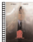
LA CASA DE JACK Lars von Trier (2018) Suspense

La película explora los límites entre la realidad y la ficción, ya que parte de una historia real y trata de reconstruir la infancia y primera juventud del bailarín cubano Carlos Acosta. Yuli tiene una interesante propuesta narrativa, ya que traza un paralelismo entre la historia reciente de Cuba y la vida del propio bailarín.