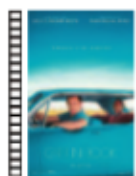
GREEN BOOK Peter Farrelly (2018) Drama

Una historia original sobre seres humanos capaces de hacer cosas extraordinarias. Gran parte de la película se desarrolla en una institución mental y no hay tanta acción como se esperaría. La tensión generada no es la habitual en una cinta de superhéroes, pero la historia atrapa de principio a fin y logra mantener en suspenso al espectador.