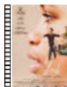
YULI Icár Bollain (2018) Cine español

"Ralph rompe Internet" sale de los recreativos, y se adentra en el mundo inexplorado, expansivo y emocionante de Internet. La ironía, la saludable sátira de ese universo que ya tenemos dentro, es la gran sustancia mágica de esta película. Todo está entre el encanto, la guasa y la maravilla.