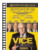
EL VICIO DEL PODER Adam McKay (2018) Comedia

Una historia ambientada en 1962, cuando un italoamericano malhablado y violento es contratado por un refinado pianista afroamericano para que le acompañe y le proteja durante su tour musical por los conservadores estados del sur de Estados Unidos. Este es un drama amable, el 'Paseando a Miss Daisy' de los tiempos modernos.