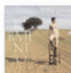
Este devenir (2020) KARMENTO Cantautores CA K

Repaso a la sólida, coherente y honesta trayectoria del grupo que ha reinventado el término de "Música para familias" en este país. El sentido del humor y los guiños a la vida diaria han sido el vehículo perfecto para explorar a través del universo infantil, todas aquellas cosas que nos gustan, nos sorprenden, nos asustan... y que son, en definitiva, sentimientos y emociones intergeneracionales universales.