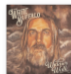
On the widow's walk (2020) THE WHITE BUFFALO Rock PR W

Es la figura más importante del hip hop español, la que más ha hecho por su popularización y la que más, y mejor, la ha abierto a otros géneros. Pero es que, además, es de las pocas que ha influido y sigue siendo un referente para las nuevas generaciones más cercanas al trap y al reggaetón, demostrando su carácter de incansable buscadora de nuevos sonidos, siempre siendo coherente con ella misma.