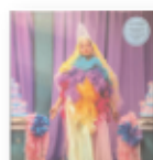
Miss Colombia (2020) LIDO PIMIENTA Nuevas músicas NMP

Pimienta habla desde su triple otredad como mujer, negra y migrante colombiana radicada en Toronto. En Miss Colombia sigue esa exploración de la música colombiana (cumbia, porro, champeta) moldeada con su personalísima paleta de electrónica, reggaetón y dancehall. Sin duda este disco es un viaje luminoso que está entre lo más relevante editado en 2020.