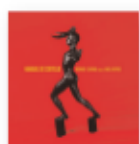
Manual de cortejo (2019) RODRIGO CUEVAS Folk MPC

La carrera de esta mujer ha sido fulgurante. Éste es su octavo disco y tan sólo tiene 25 años. La trompetista, saxofonista y cantante va camino de convertirse en toda una estrella, si no lo es ya. Pero ella se lo toma con mucha tranquilidad, apelando a una sencillez que es su distintivo personal. Y en esa ruta hacia el estrellato ha recalado en un refugio muy querido por los amantes del jazz: la música brasileña.