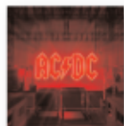
Power up (2020) AC/DC Rock PR A

Con este disco Rodrigo Cuevas nos recuerda una cosa: nos hemos olvidado de lo imprescindible. Explorar el pasado (sin olvidar el presente y el futuro), la tradición, los cantes antiguos. Con la excelsa producción de Raül Refree, esta gran coalición consigue una obra con la filosofía de los Hermanos Cubero y la actitud excéntrica de Niño de Elche.