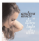
Do outro lado do azul (2019) ANDREA MOTIS Jazz JBS M

Extraordinario disco de los irlandeses tras su fenomenal "Dogrel" hace dos años. Siempre que se dice que el rock o la música de guitarras se ha agotado en beneficio de modas más o menos efímeras aparece un grupo que lo desmiente. Pocos casos más palmarios que el de los irlandeses, empeñados en revitalizar el poder cártico y poético del rock, poniendo de acuerdo a varias generaciones.