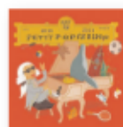
Petitpopísimo 2010-2017 (2017) PETIT POP Música infantil MIP

Pimienta habla desde su triple otredad como mujer, negra y migrante colombiana radicada en Toronto. En Miss Colombia sigue esa exploración de la música colombiana (cumbia, porro, champeta) moldeada con su personalísima paleta de electrónica, reggaetón y dancehall. Sin duda este disco es un viaje luminoso que está entre lo más relevante editado en 2020.