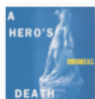
A hero's death (2020) FONTAINES D.C. Rock PR F

Más allá de la honestidad de sus fines, la capacidad de Mecano para trascender géneros estaba en sintonía con genios como ABBA, donde el fin último era tan subjetivo como vibrante: moldear la canción pop perfecta. Su legado artístico hoy día está fuera de toda duda y el tiempo ha permitido ahogar todos los prejuicios y empezar a recoger las alabanzas merecidas.