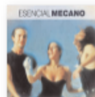
Esencial (2012) MECANO Pop MP M

Excelente trabajo que gustará a quienes gusten de un buen disco de cantautora, pero también a quienes busquen un punto folk, o a quien quiera emocionarse durante media hora. La albaceteña sabe aprovechar su vozarrón al máximo, alternando los momentos suaves con una garra envidiable, y llevándonos por distintas historias en temas que van del flamenco a las seguidillas manchegas, ¡y hasta con toques de música étnica!