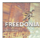
FREEDONIA Shenobi (2017) Soul

Radiografía un tiempo que el propio autor resume en uno de los temas como “de codicia, de hipocresía y de malversación”. Todo el disco orbita en torno a la degradación sufrida los últimos años a causa del colosal pufo financiero y todas sus penosas consecuencias para los peor situados socialmente.