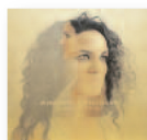
ANOUSHKA SHANKAR Land of gold (2016) Música popular

Convierte estas canciones ya conocidas en una delicatessen para oídos inquietos. Grabado con un quinteto de cuerdas, este excepcional proyecto tiene mucho de obra espontánea y al mismo tiempo está muy mimada. Silvia sigue alimentando su propia leyenda.