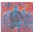
LITTLE STEVEN Sulfire (2017) Rock

Con un fondo folk acústico de instrumentos de cuerda, contrabajo y percusiones, unos arreglos preciosistas y la linda voz de Natalia Lafourcade, construye doce canciones de aire íntimo, atrayente y seductor. Un clásico con composiciones propias.