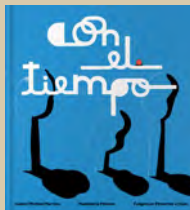
Con el tiempo Isabel Minhós Martins Madalena Matoso (il.) Fulgencio Pimentel e hijos, 2021