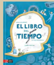
El libro del tiempo Gillaume Duprat Olivier Charbonnel Zahorí, 2021