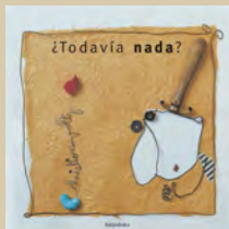
¿Todavía nada? Christian Voltz Kalandraka, 2003