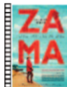
ZAMA Lucrecia Martel (2017) Drama

P'tit Quinquin es un chico de unos diez años que vive en la granja de su familia. Al comienzo de sus vacaciones mata el tiempo con sus dos amigos y su novia Eve, paseándose en bicicleta y haciendo bromas con petardos. Un hecho extraordinario lo cambiará todo. Una miniserie original y fuera de todas las convenciones.