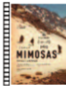
MIMOSAS Oliver Laxe (2016) Cine español

En junio de 1971, los principales periódicos de EE.UU. optaron por la libertad de expresión e informaron sobre los documentos del Pentágono y el encubrimiento masivo de secretos por parte del gobierno. Historia basada en los documentos del Post que recogían información clasificada sobre la Guerra de Vietnam.