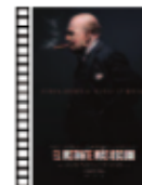
EL INSTANTE MÁS OSCURO Joe Wright (2017) Histórico

Cinta desapacible y amarga, que juega con destreza con los saltos temporales, que muestra la cara y la cruz del afecto, que desvela las mentiras inconfesables de las relaciones, que denuncia las tretas y ruindades del despecho... Quizás no nos guste vernos reflejados en este espejo doloroso, pero es lo que hay.