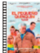
EL PEQUEÑO QUINQUIN Bruno Dumont (2014) Miniserie de TV

El Gran Showman es justamente lo que representa, un producto de entretenimiento elaborado con todo el detalle y experiencia para aquellos que gusten de los musicales. El gran atractivo de la película radica en las interpretaciones, aportando grandes momentos musicales y actuaciones de calidad que te mantendrán enganchedo.