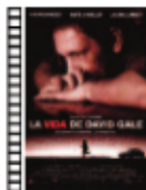
LA VIDA DE DAVID GALE Alan Parker (2003) Suspense

Para todos los entendidos es sin duda la mejor versión cinematográfica de esta portentosa obra eterna, narrada deliciosamente e interpretada sobria y majestuosamente. Destaca por encima de todos Alec Guinness, que fue maestro del "disfraz" interpretativo, y que compuso una memorable representación del avaro judío Fagin.