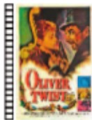
OLIVER TWIST David Lean (1948) Drama

Una caravana transporta a un anciano moribundo. Su última voluntad es ser enterrado junto a los suyos, pero muere mientras suben las escarpadas cumbres del Atlas marroquí. Los viajeros, temerosos de la montaña, se niegan a seguir transportando el cadáver, pero dos buscavidas que viajan con la caravana se ofrecen a llevar el cuerpo.