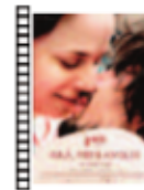
ANA, MON AMOUR Calin Peter Netzer (2017) Drama

Este oso llega solo a una ciudad desconocida pensando que la vida humana es muy sencilla. Ahí es cuando descubrirá que las personas no somos tan buenas como le contó un explorador que visitó a sus tíos en Perú. Ambas películas deberían prescribirse como antídoto para los que les molesta la locura del mundo moderno.