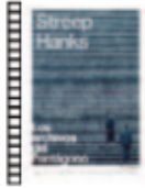
LOS ARCHIVOS DEL PENTÁGONO Steven Spielberg (2017) Drama

En junio de 1971, los principales periódicos de EE.UU. optaron por la libertad de expresión e informaron sobre los documentos del Pentágono y el encubrimiento masivo de secretos por parte del gobierno. Historia basada en los documentos del Post que recogían información clasificada sobre la Guerra de Vietnam.