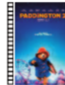
PADDINGTON (2014) Y PADDINGTON 2 (2017) Paul King (2017) Cine infantil

Puede pasar en cualquier familia tanto afroamericana como europea. Nos presenta a Regina, madre soltera afroamericana de condición humilde, que se pasa todo el día trabajando para sacar a su familia adelante. Un núcleo familiar disgregado por la ausencia de la figura paterna y por el conflicto entre el protagonista y su madre.