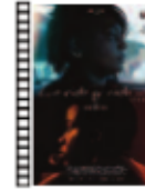
LA VIDA Y NADA MÁS Antonio Méndez Esparza (2017) Cine español

Basada en la novela de Antonio Di Benedetto escrita en 1956, narra la historia de Don Diego de Zama, un oficial español del siglo XVII asentado en Asunción que espera su transferencia a Buenos Aires. Es un hombre que espera ser reconocido por sus méritos, pero la esperanza también puede cobrarse "víctimas". Hipnótica y única.