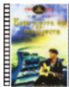
ESTA TIERRA ES MI TIERRA Hal Ashby (1976) Drama

Cuando se llama "paz" a la guerra, cuando la propaganda es presentada como la verdad, cuando se llama "amor" al odio, es ahí donde la misma vida comienza a parecerse a la muerte. Burócratas, familias desestructuradas, burgueses, soldados, paramilitares..., en un fresco aberrante de inmoralidad y desesperación.