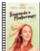
BIENVENIDA A MONTPARNASSE Léonor Serraille (2017) Drama

Zhang Yimou ofrece un filme bellissimo, una tragedia sobre la ambición política en la China feudal y el papel siempre complejo del doble. La puesta en escena es de una belleza sobrecogedora, hija de un talento visual que pocos poseen en el cine contemporáneo. Es género 'wuxia' con la misma claridad que poema épico visual.