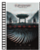
SOMBRA Zhang Yimou (2018) Drama

Parece un drama, pero en realidad es una magnífica y luminosa comedia dramática, tan lúdica como severa, moldeable y preciosa. Una buena historia llena de giros y pistas falsas hacen que la película se vuelva muy entretenida con este trío de protagonistas.