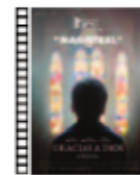
GRACIAS A DIOS Francois Ozon (2018) Drama

Cómica, tierna, conmovedora, seria y entretenida. Una metáfora que combate los prejuicios y la exclusión con la excusa de una aventura animada. Notable relato con personajes con encanto, la dosis adecuada de humor y una buena utilización de la época en la que se ambienta.