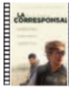
LA CORRESPONSAL Matthew Heineman (2018) Cine Bélico

Película articulada alrededor del deseo de «abrirse», de conectar -desde una soledad incómoda- con el otro, aunque éste nos dé la espalda, nos escupa y nos desprecie. Un retrato simpático, mordaz y cómico que ofrece dos descripciones fascinantes por el precio de una: la de París y la de la protagonista.