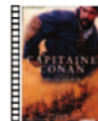
CAPITÁN CONAN Bertrand Tavernier (1996) Cine Bélico

Completa, amena, bien narrada e interesante película de intriga bañada en comedia. Además de un divertido entretenimiento, constituye un agradecido y documentalista retrato sobre una pequeña parte de la cultura popular castiza, siendo el histórico Rastro de Madrid el escenario de la detectivesca trama.