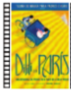
DILÍ EN PARÍS Michel Ocelot (2018) Animación

Entre naif, didáctico y delicioso en el color y la animación, la película es una especie de homenaje a la ciudad de París en clave de folletín y con rasgos próximos a los cómics de Jacques Tardi. Narra las aventuras, a finales del siglo XIX, de una niña mestiza y su improvisado amigo en el París de la Belle Époque.