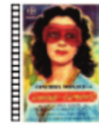
DOMINGO DE CARNAVAL Edgar Neville (1945) Cine español

Drama sobre 'reprogramación' sexual juvenil dentro de un campamento cristiano. Un perfecto retrato de la invasión adulta en el mundo adolescente, en este caso del asedio ideológico y religioso al que se somete a los jóvenes que buscan su propia sexualidad.