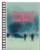
DONBASS Sergei Loznitsa (2018) Drama

Una mirada digna a los últimos momentos de vida de la reportera de guerra Marie Colvin. Su compleja personalidad, su valentía, sus traumas, su miedo, su fe en lo que pensaba y sentía. Y la gran paradoja de su vida: la adicción a su trabajo, el refugio donde se sentía más cómoda, entre bombas, tiros, cinismo y muerte.