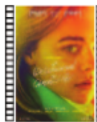
LA (DES)EDUCACIÓN DE CAMERON POST Desiree Akhavan (2018) Drama

Historia del cantante y compositor Woody Guthrie, el padre de todos los cantautores protesta. Ambientada en la época de la Gran Depresión (años 30), presenta al cantante recorriendo América en ferrocarril, gracias a lo cual llega a conocer a muchísima gente afectada por la miseria más extrema.