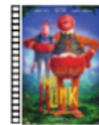
MR. LINK. EL ORIGEN PERDIDO Chris Butler (2019) Dibujos

En noviembre de 1918 se firma en París el armisticio que pone fin a la Primera Guerra Mundial. Sin embargo, la noticia de la desmovilización no llega al frente oriental, donde una fracción del ejército francés sigue actuando a las órdenes del expeditivo Capitán Conan. Espléndida película antibelicista con notables interpretaciones.