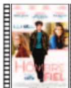
UN HOMBRE FIEL Louis Garrel (2018) Comedia

Entre naif, didáctico y delicioso en el color y la animación, la película es una especie de homenaje a la ciudad de París en clave de folletín y con rasgos próximos a los cómics de Jacques Tardi. Narra las aventuras, a finales del siglo XIX, de una niña mestiza y su improvisado amigo en el París de la Belle Époque.